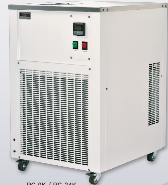
RC-9K / RC-24K