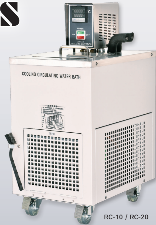
RC-10 / RC-20